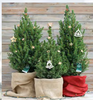
Zuckerhutfichte Alle Sorten lagernd!